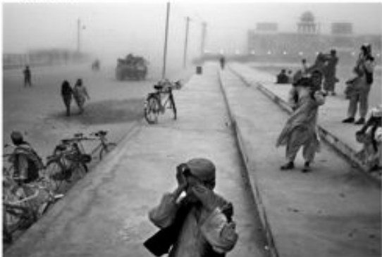
2001-2002/VIETNAM